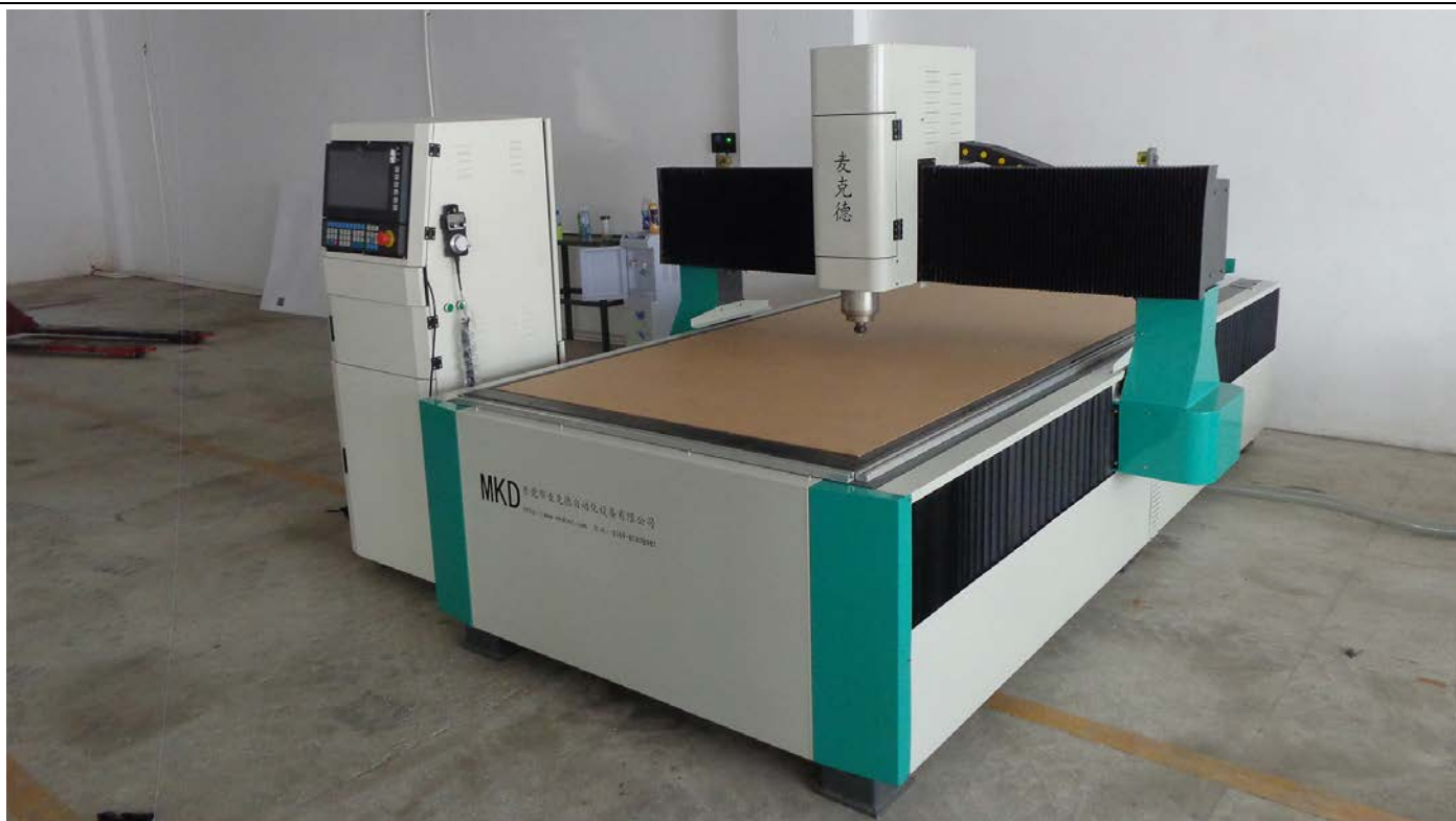
(产品实拍，部分已改进)