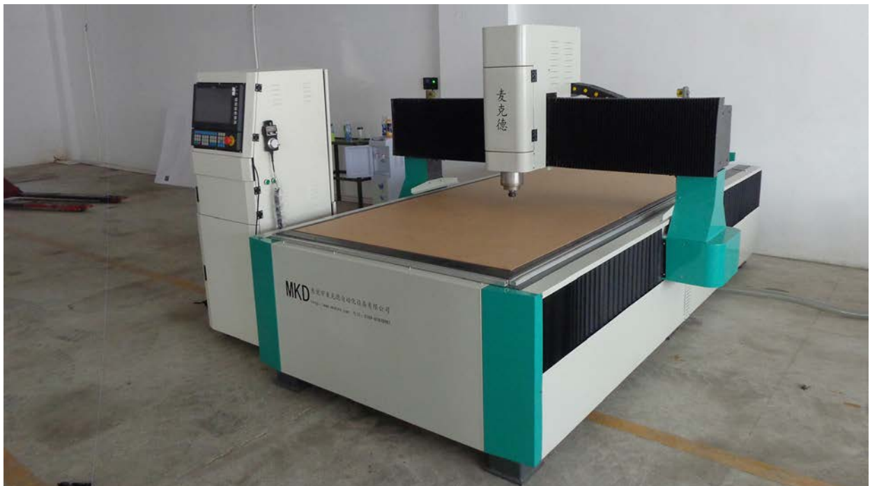
(此为实物, 部分已改进)