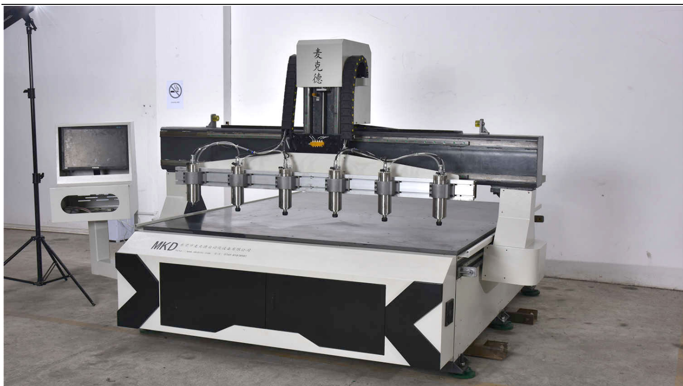
(实拍，图片控制箱为 PCI 控制卡，搭配电脑，标准机型为一体式控制箱，下同)